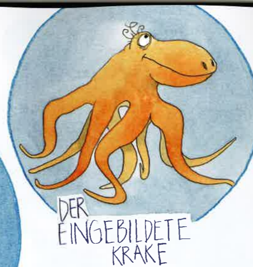
DER EINGEBILDETE KRAKE

Drewelow: Ich bin immer wieder erstaunt, was die Leute für Sprünge machen,