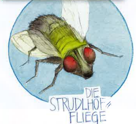
DIE STRUDLHOF- FLIEGE

LiteraTiere Die Ausstellung ist bis 3. September in den Komischen Künsten im MuseumsQuartier zu sehen. Der Eintritt ist frei! Um 10 Euro können Sie den LiteraTiere-Kalender im MQ und am 23./24. Juni bei Rund um die Burg im Zelt neben dem Burgtheater erwerben. Dort haben die Komischen Künste nämlich neben der Buchhandlung BuchKontor einen Stand.