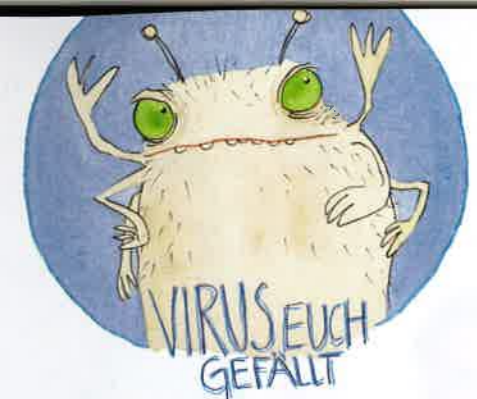
VIRUS EUCH GEFALLT

wenn sie dranbleiben und sich aufs Zeichnen einlassen. Ich habe aus vielen Zeichenkursen noch Kontakte, am Ende bekommen alle immer alle Adressen und sind eingeladen, sich Postkarten zu zeichnen. Das motiviert, das Format ist auch im Arbeitsalltag zu wuppen und die Leute bleiben dran. Wer freut sich nicht über eine selbst gezeichnete Karte? Der Weg dahin ist: selber zeichnen, es kommt garantiert was zurück. – Das ist übrigens eine der tollen Angewohnheiten, die ich von F. W. Bernstein übernommen habe, der hat es in seinen Kursen ähnlich gemacht.